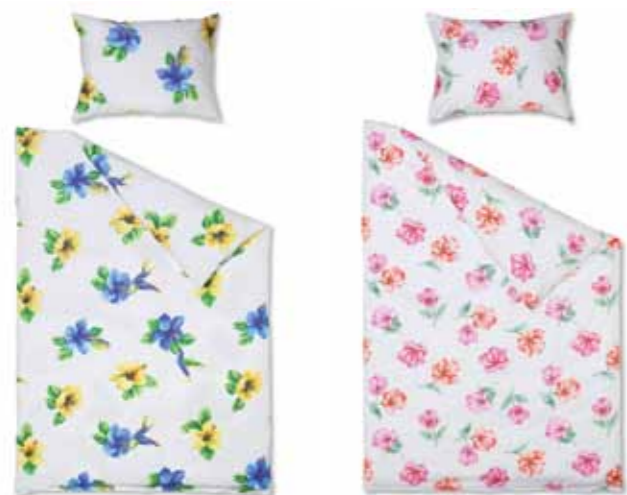
Dessin 3990 Rosenblüte - 090 fuchsia / 150 rot Dessin 4990 Schneeleopard - 450 silber / 645 chocolat Dessin 5990 Kolibri - 075 blau / 090 fuchsia Dessin 6990 Hibiscus - 105 flieder/ 150 rot